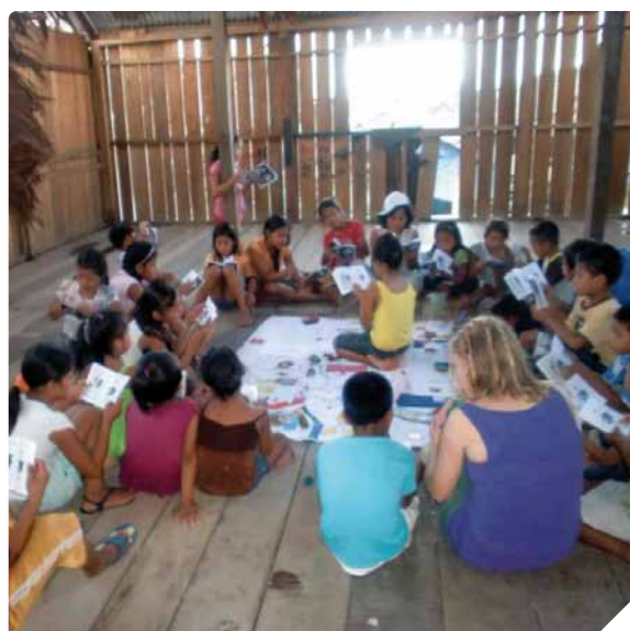
Taller de niños/as del Sector 9. Trabajando riesgo de violencia sobre el mapa del distrito de Belén

Máster Interuniversitario en Cultura de Paz, Conflictos, Educación y DD.HH.