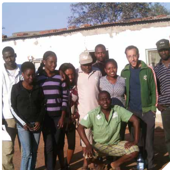
Grupo de trabajo compuesto por alumnos del ISPG y la Universidad Eduardo Mondlane