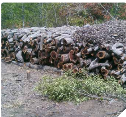
Madera de mopane apilada para hacer carbón