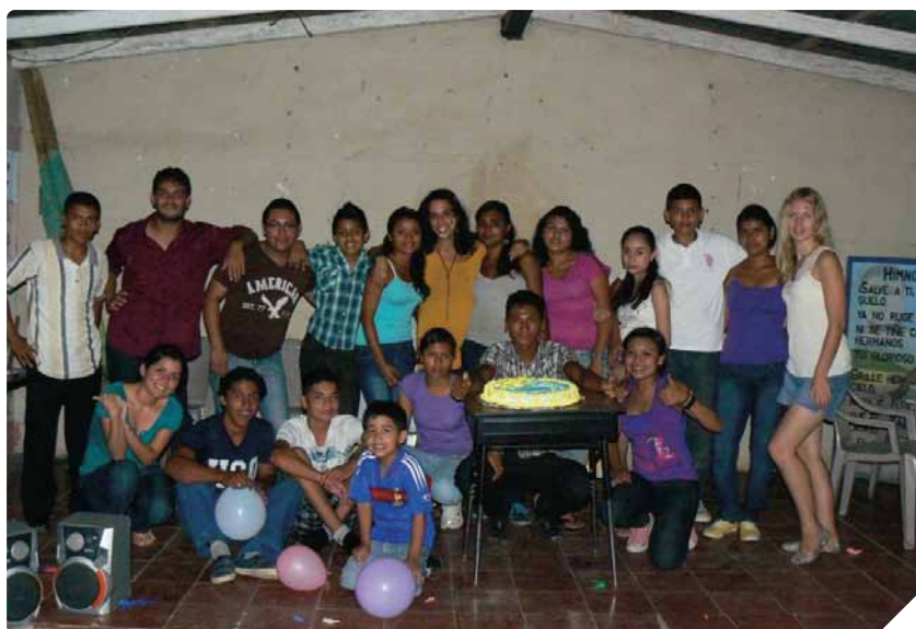
La gran familia de APAN

Titulación: Licenciada en Psicopedagogía