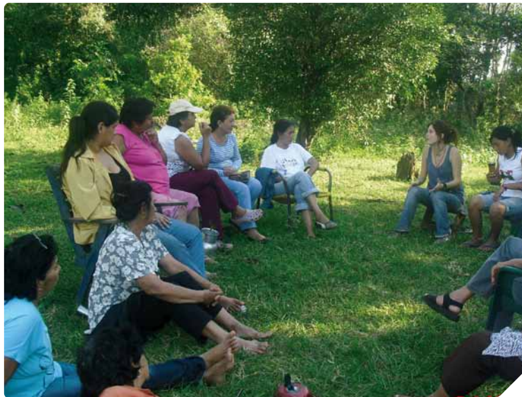
Tertulia con mujeres campesinas después de talleres agroecológicos