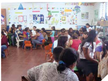
Escuela de Madres y Padres (MAPAS): trabajando en equipo

Fue allí donde, durante tres meses, desarrollé mi proyecto de cooperación: «Situación de las familias y rol de las mujeres en la comunidad de Diriamba (Nicaragua). Análisis de necesidades y programa formativo».