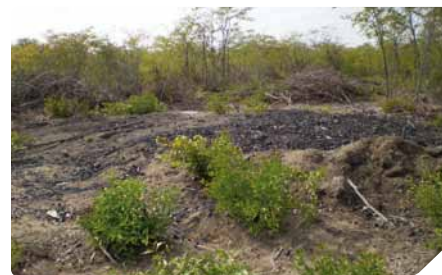
Área deforestada después de hacer carbón

Es de extrema importancia analizar de forma sistemática la dinámica de los ecosistemas del bosque tropical seco dada su importancia para la contribución del equilibrio del ecosistema terrestre y para la sustentabilidad de las comunidades.