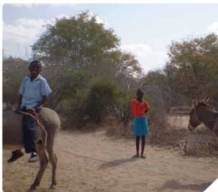
Niños en el distrito de Mabalane

Un país con mucha energía, donde todo el mundo está todo el día vendiendo y todo tiene arreglo, por muy difícil que parezca. Donde los niños no necesitan caros y tecnológicos juguetes para ser felices y suplen la falta de dinero con imaginación y con unas pocas latas de refrescos, alambres y poco más, ya tienen su juguete. Si bien, no todos los niños tienen esa suerte, ya que algunos tienen que conseguir dinero, ya sea vendiendo cualquier cosa, sacando el ganado a pastar, vendiendo saldo para el móvil o mendigando algo de dinero en las calles.