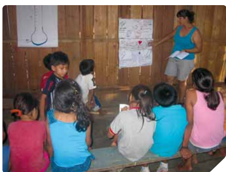
Trabajando «emociones» a través de los cuentos amazónicos, con el personaje del Chullachaqui, un ser mágico de la selva

Para mí ha sido una gran oportunidad poder trabajar con el equipo de La Restinga y participar en este hermoso proyecto, duro por una parte, pero muy satisfactorio por otro, porque después de 4 años de ejecución se han alcanzado grandes logros con la población de Belén. Las educadoras de La Restinga no sólo me hicieron sentir como una más, sino que, desde un punto de vista técnico, han sabido realizar muy buen trabajo con tres grupos de diferentes perfiles: niños/as, adolescentes (promotores) y madres, trabajando simultáneamente para crear redes de socialización y respeto y cambiando el entorno hostil al que pertenecen. Todo un logro.