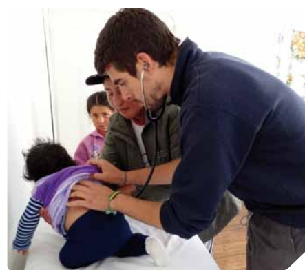
Auscultando a uno de los 51 niños que acudieron a la campaña médica gratuita

En este sentido, gracias a la oportunidad que se nos ha dado de formarnos en los cursos de cooperación y de poder realizar nuestro proyecto en terreno, hemos adquirido una nueva visión de la realidad, que es la que debemos transmitir a todos nuestros compañeros de la comunidad universitaria para invitarles a reflexionar y a luchar por conseguir entre todos un mundo mejor.