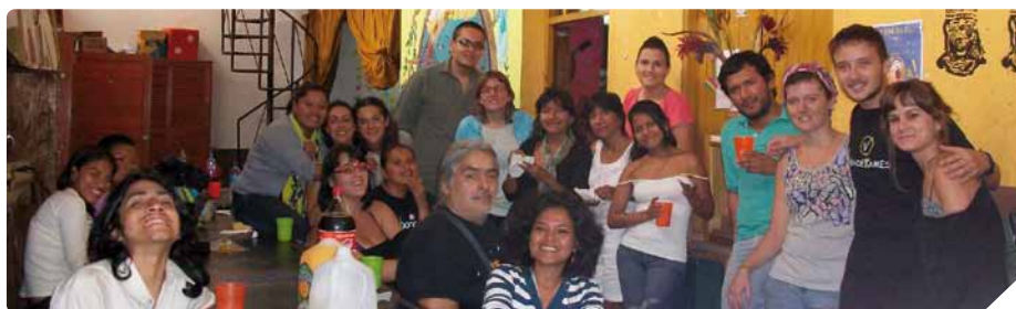
La gran familia Restinga en la ciudad de Iquitos

En este contexto, la Asociación La Restinga lleva trabajando con niños/as de la calle desde hace 15 años a través de diferentes proyectos. En concreto lleva 4 años en el Proyecto «Crea Belén». El método de trabajo incluye talleres, asistencia y visitas a las familias. Los grupos con los que trabaja son: niños/as, adolescentes y madres. Todo este proceso ha facilitado que estos grupos puedan contar con una serie de nuevas competencias personales y sociales para poder enfrentar la situación de pobreza que les embarga. Participantes que después de un proceso educativo, de formación y terapéutico, tienen la opción de cambiar la visión de ellos/as mismos/as y de sus problemas, dejando atrás patrones de conducta que los victimiza. Asumiendo paulatinamente protagonismo en sus vidas y convirtiéndose en formadores de los/as que les rodean. Apoyando diversos procesos educativos que fortalecen sus procesos personales de cambio a la vez que los visibiliza ante una sociedad que los invisibiliza.