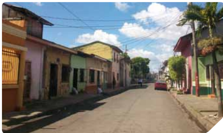
Calles de Diriamba