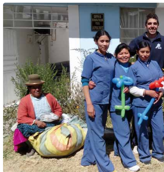
A las puertas de la Clínica APAINÉ junto con sus trabajadoras

Sexto curso de la Licenciatura de Medicina