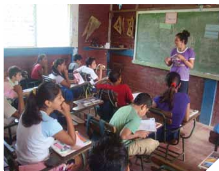
Programa «100PRE uso condón»: Plan de prevención frente al VIH

APAN , es una Escuela para la Vida , y como tal, cuenta con la completa dedicación de personas formadas en el ámbito psico-educativo, y sobretodo personas que constituyen todo un ejemplo de profesionalidad, perseverancia, ilusión y valentía.